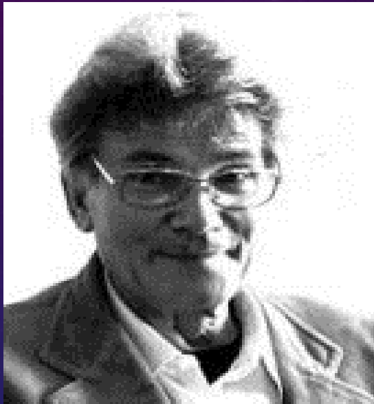
Gaetano Kanizsa (1913-1983)