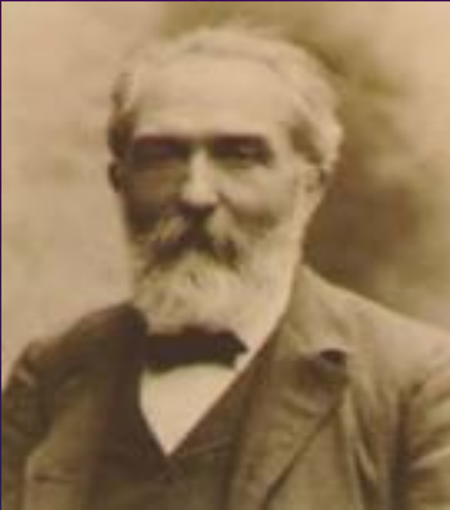
Giuseppe Sergi (1841-1936)