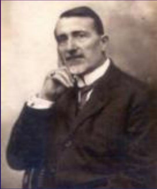
Sante De Sanctis (1862-1935)