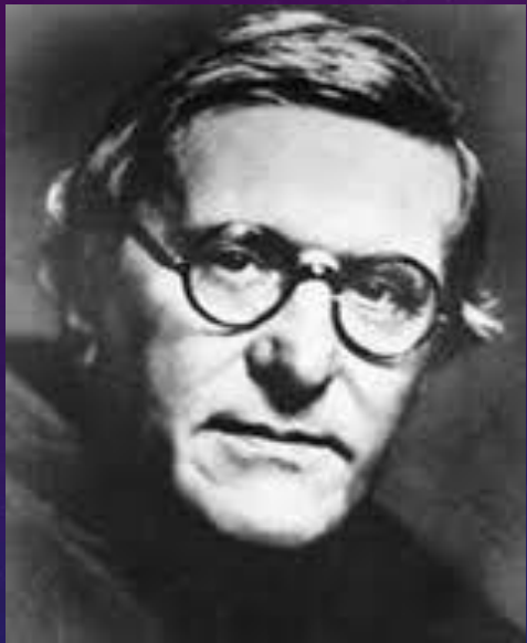
Agostino Gemelli (1878-1959)